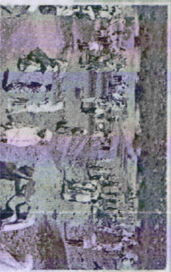
ఉపాధి పనులు చేస్తున్న కులీలు

గ్రామ, మండలస్థాయిలో ప్రత్యేక రెజిస్టరు సౌకర్యకర, సర్వేక్షణకు కేంద్రం ఏర్పడింది అక్రమాలను అరికట్టేందుకు ప్రభుత్వం చర్యలు