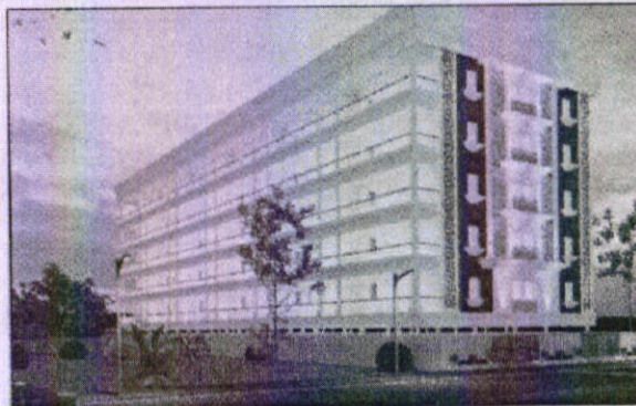
నాయుడుపేటలోని శుభంగ రెసిడెన్సీ

నాయుడుపేట, నవంబర్ 14 (ప్రభస్వామి): దేశవిదేశాలకు చెందిన భారీ పరిశ్రమలు సూళ్లూరుపేట నియోజకవర్గంలో ఏర్పాటు చేయడంతో పారిశ్రామికంగా ఈ ప్రాంతం ఎంతో అభివృద్ధి చెందుతోంది. అంతేకాకుండా వాణిజ్య పరంగా కూడా