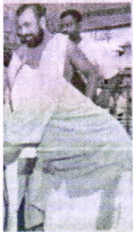
Ammavari prasadam temple