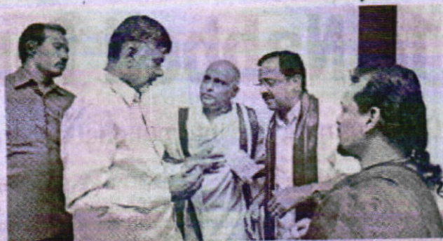
Chief Minister N Chandrababu Naidu being extended an invitation for the Dasara festival at the Durga temple by temple executive officer Ch Narasingarao (2nd right) in Vijayawada on Thursday.

Two fodder banks are proposed in the district with 20,000 sq ft floor space - one at Reddipalli and the other at Penu-