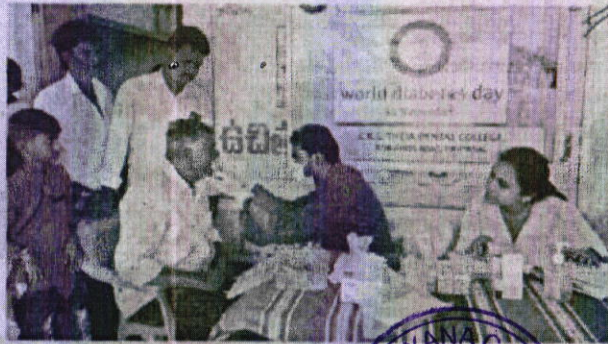
రోగిన పరిక్షిస్తున్న వైద్యులు